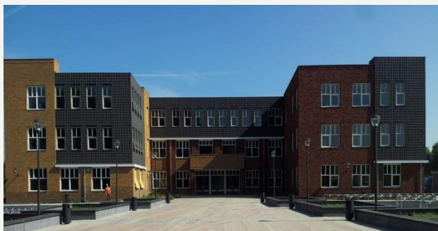
Het Carolus Borromeus College in Helmond

Iedere maand staat er een aangesloten school uit ons samenwerkingsverband in onze nieuwsbrief. Deze maand het Carolus Borromeus College. Het Carolus Borromeus College is een deelschool van OMO Scholengroep Helmond. Sinds schooljaar 2014-2015 is de school gevestigd op aan Markesingel in Helmond. Voorheen kende het Carolus Borromeus College drie vestigingen: locatie Gasthuisstraat (hoofdlocatie), Hurksestraat (mavo-plus) en Lauwerstraat (mavo-plus). Leerlingen kunnen hier terecht met een advies vmbo theoretische leerweg, havo, vwo en gymnasium. Het Carolus Borromeus College telt 1187 leerlingen. Meer informatie vindt u op de website van het Carolus Borromeus College.