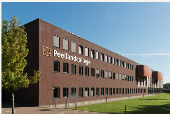
Peellandcollege te Deurne

Iedere maand staat er een afbeelding van een aangesloten school uit ons samenwerkingsverband in onze nieuwsbrief. Deze maand: het Peellandcollege. Het Peellandcollege is een deelschool van de Instelling Voortgezet Onderwijs Deurne (IVO-Deurne) en is gevestigd aan de Vloeieindsedreef 5 in Deurne. De school telt in totaal 1113 leerlingen. Het Peellandcollege biedt onderwijs aan havo- en vwo-leerlingen. Meer informatie over het Peellandcollege kunt u vinden op hun website .