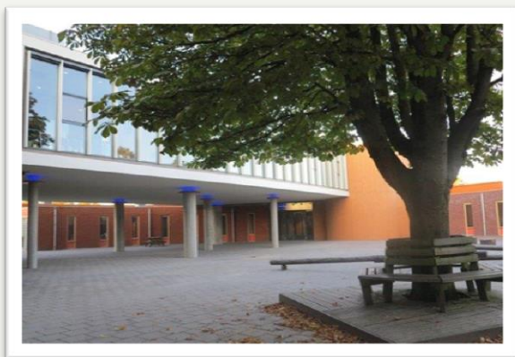
De Hilt in Helmond

Iedere maand staat er een afbeelding van een aangesloten school uit ons samenwerkingsverband in onze nieuwsbrief. Deze maand: De Hilt. De Hilt is een school voor speciaal (voortgezet) onderwijs voor leerlingen met een toelaatbaarheidsverklaring (tlv) van 5 t/m 18 jaar. Op de Hilt wordt gewerkt aan de voorbereiding van een overstap naar het reguliere onderwijs (vo of mbo), arbeidsmarkt of een combinatie van leren en werken. In totaal zitten er 125 leerlingen uit de regio op de vso-afdeling van de Hilt. De school is gevestigd aan de Azalealaan in Helmond. Meer informatie over de Hilt kunt u vinden op hun website .