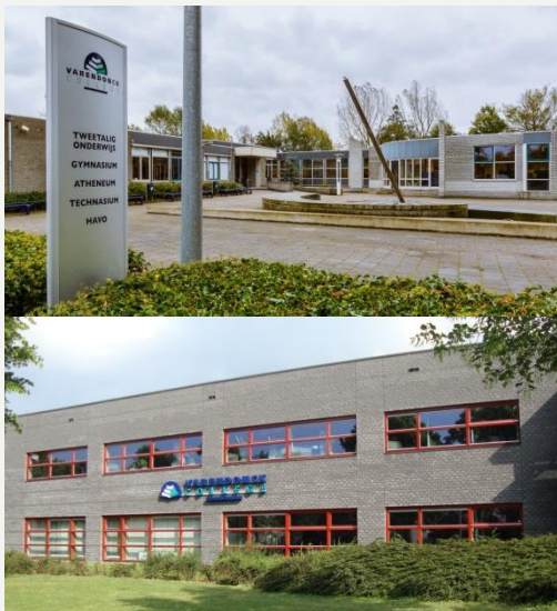
Het Varendonck College, boven: locatie Asten, onder: locatie Someren

Het Varendonck College telt in totaal 2036 leerlingen. De leerlingen komen vooral uit Asten en Someren, maar ook vanuit Geldrop, Heeze-Leende, Mierlo en Deurne. Meer informatie over het Varendonck College vindt u op hun website .