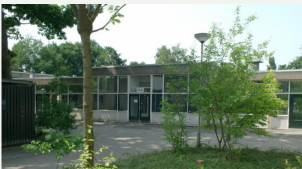
VSO de Korenaer in Deurne

Iedere maand staat er een afbeelding van een aangesloten school uit ons samenwerkingsverband in onze nieuwsbrief. Deze maand VSO de Korenaer. De Korenaer is een deelschool van de Aloysiusstichting en is gevestigd aan de Mr. De Jonghlaan in Deurne. De Korenaer verzorgt onderwijs voor leerlingen tussen de 12 en 21 jaar met ernstige gedragsproblemen die residentieel of met een maatregel geplaatst zijn op het internaat van BJ Brabant. Ook externe leerlingen met een toelaatbaarheidsverklaring volgen hier onderwijs. De Korenaer verzorgt voortgezet speciaal onderwijs en middelbaar beroepsonderwijs niveau 1 en 2. De Korenaer telt ongeveer 125 leerlingen, waarvan er een tiental onderwijs op afstand volgen. Meer informatie over de Korenaer Deurne vindt u op hun website .