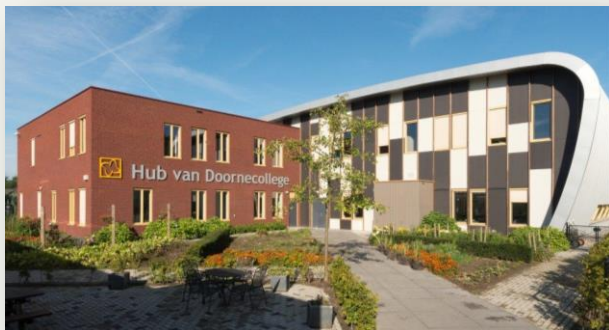
Het Hub van Doornecollege in Deurne

Iedere maand staat er een afbeelding van een aangesloten school uit ons samenwerkingsverband in onze nieuwsbrief. Deze maand het Hub van Doornecollege. Het Hub van Doornecollege is een deelschool van de Instelling Voortgezet Onderwijs Deurne (IVOD) en is gevestigd aan de Vloeiendredreef in Deurne. Leerlingen met een advies vmba basisberoepsgerichte leerweg en vmba kaderberoepsgerichte leerweg kunnen terecht op het Hub van Doornecollege. De school telt 692 leerlingen. Meer informatie vindt u op de website van het Hub van Doornecollege.